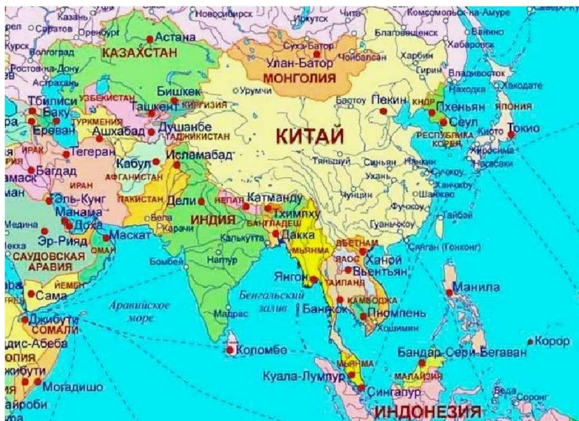
Политическая карта азиатского региона